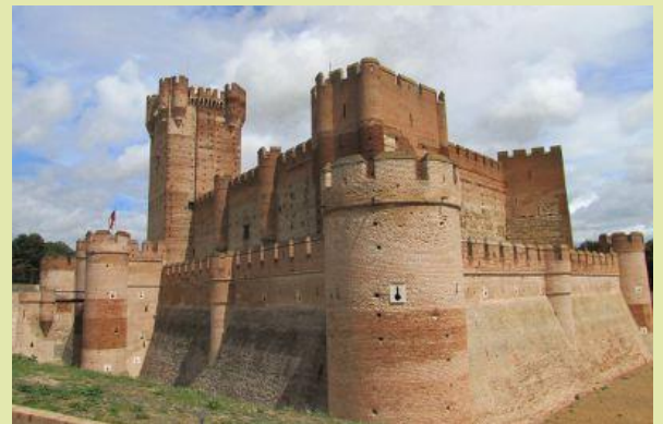
Castelo de la Mota – Medina del Campo

Inclui- transporte em autocarro de turismo; 3 noites de alojamento em hotel de 4 estrelas; 4 almoços e 2 jantares; visitas guiadas conforme programa ; acompanhamento por guia da Noventur; IVA, Seguro de viagem. SINALIZAÇÃO DE 150€ até 20/08